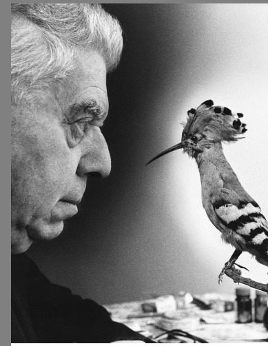
ugo mulas EUGENIO MONTALE, 1970

Non fai solo una fotografia con una macchina fotografica. Tu metti nella fotografia tutte le immagini che hai visto, i libri che hai letto, la musica che hai sentito, e le persone che hai amato. ANSEL ADAMS